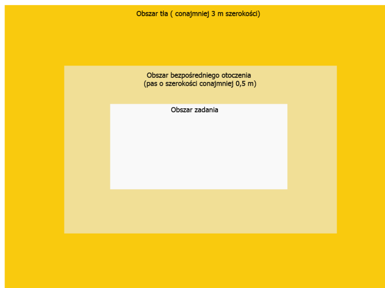
Rys. 2. Pole pracy i jego otoczenie

Norma wprowadziła pojęcia obszaru zadania, obszaru bezpośredniego otoczenia i obszaru tła – rys. 2.