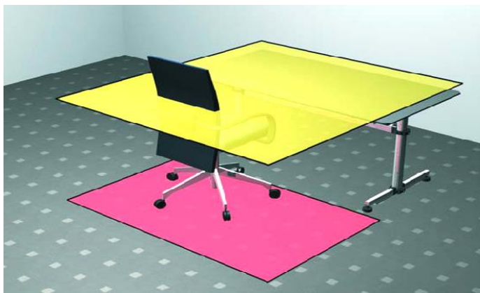
Rys. 3. Pole pracy dla stanowiska biurowego (wg ZVEI Guide to DIN EN 12464-1)

Jeżeli w pomieszczeniu – np. w sali wykładowej, pola pracy i otoczenie nakładają się, wtedy należy je zastąpić jednym polem pracy, z pominięciem pasa przyściennego o szerokości 0,5m – rys.4.